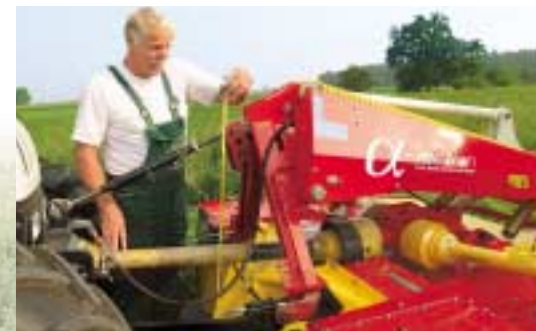
Der neue Mäher von Pöttinger lässt sich problemlos an jeden Traktor anbauen. Dabei ist nur die Höhe der Hydraulik zu kontrollieren.

Der Pendelbereich der Mäheinheit beträgt 350 mm nach oben und 250 mm nach unten. Schwenkt das Mähwerk beim Durchfahren einer Muldensohle nach oben, neigt sich der Mähbalken bis zu 12° nach hinten und vermeidet dadurch ein Einstechen der Mähklingen in den Boden. Umgekehrt, zB beim Überfahren von Kuppen, schwenkt das Mähwerk nach unten und neigt den Mähbalken bis zu 9° nach unten. Dadurch bleibt kein wertvolles Futter stehen, wie es bei konventionellen Anlenksystemen häufig der Fall ist.