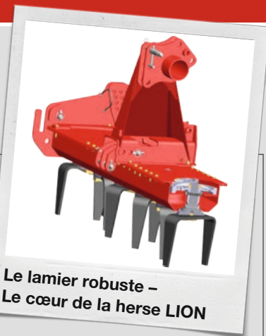
Le lamier robuste – Le cœur de la herse LION

Les herses rotatives LION garantissent un fonctionnement silencieux et une robustesse extrême. Même dans les conditions les plus dures et sur sols très lourds, votre herse PÖTTINGER reste fiable. Chez PÖTTINGER, la précision et la robustesse de construction sont un standard et une garantie de longévité.