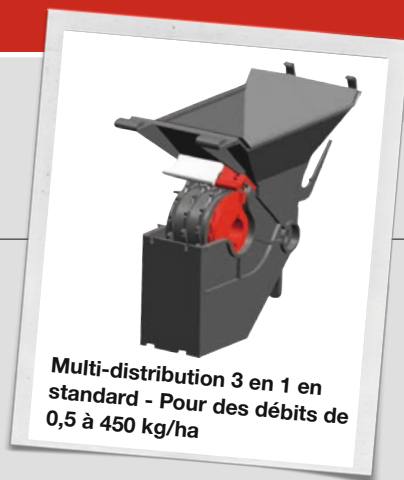
Multi-distribution 3 en 1 en standard - Pour des débits de 0,5 à 450 kg/ha

Les semoirs VITASEM se distinguent par leur fonctionnalité exemplaire, leur grande précision de semis et leurs performances inégalées.